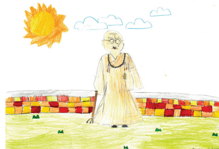
Si Xuan 画