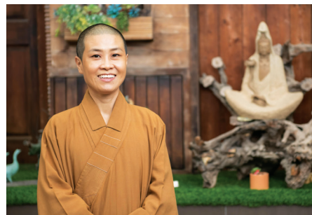
I miss you

在大师的书籍里，还有很多事物都可以让我们学习，可以让我们生活得更圆满。感谢星云大师写了这么多利益生命的书籍，也让我们有机会和大众分享结善缘。