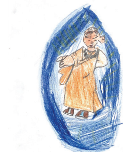
from Chien Qing Yu 詹晴羽 (P)